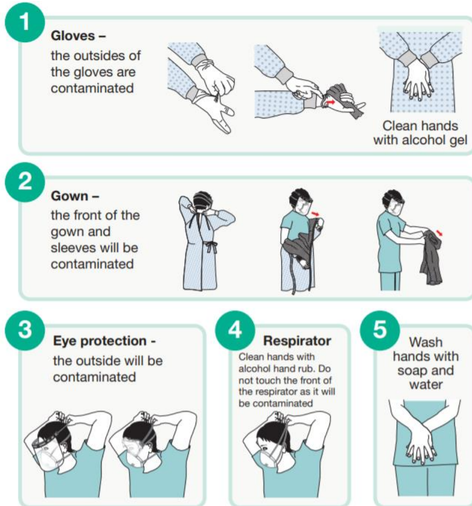
Figura 2: Immagine tratta da Public Health England

Per la procedura di svestizione si eseguirà invece in ordine inverso le operazioni precedentemente esposte, come in figura: